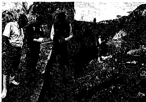
Fotografía 2. Visita, recorrido, aforamiento a la Acequia El Taladro