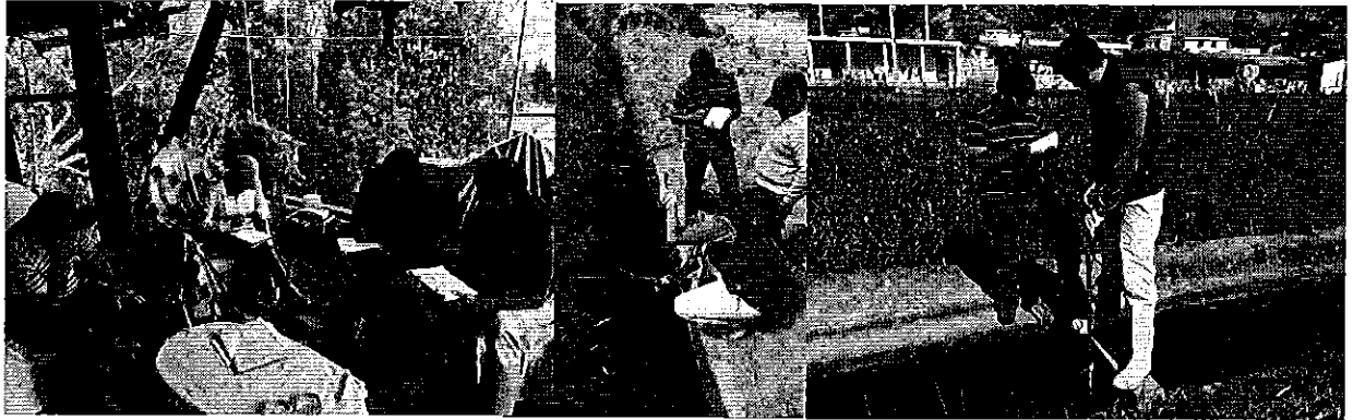
Fotografía 1. Visita, recorrido, aforamiento a la Acequia Quinchuqui Alto.