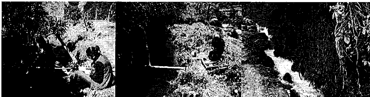
Fotografía 4. Visita, recorrido, aforamiento a la Acequia Central Chiquita