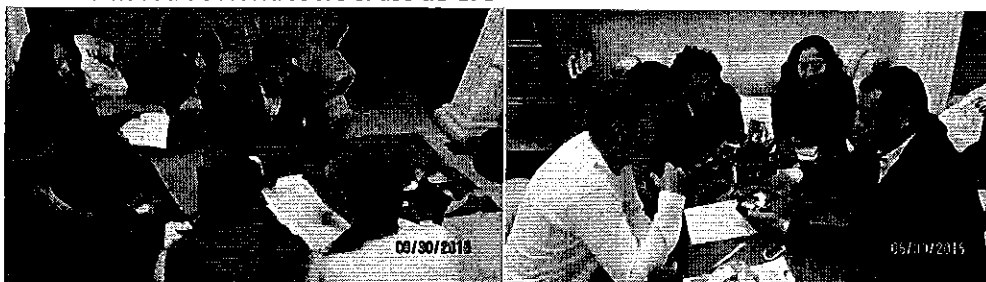
Fotografía 4. Entrega y Capacitación de GPS