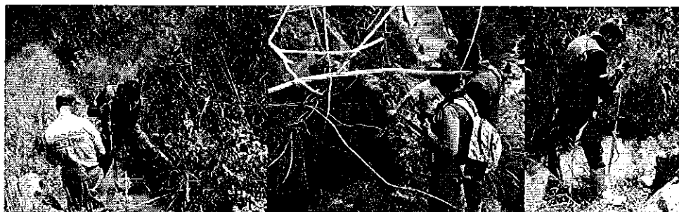
Fotografía 3. Visita, recorrido, aforamiento a la Acequia Monte Olivo San Rafael