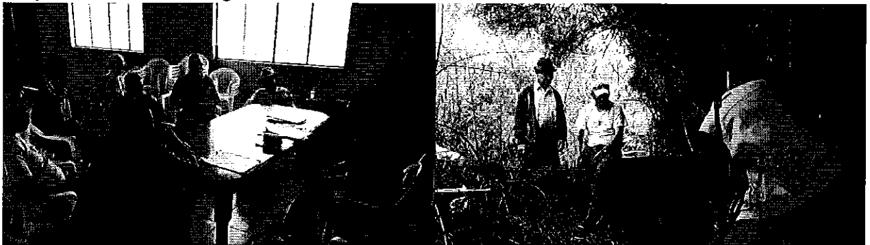
Fotografía 3. Representantes de la Junta de Riego Parceleros de la Hacienda Coñaqui (San Rafael), participantes en la reunión de trabajo y de medición de caudales