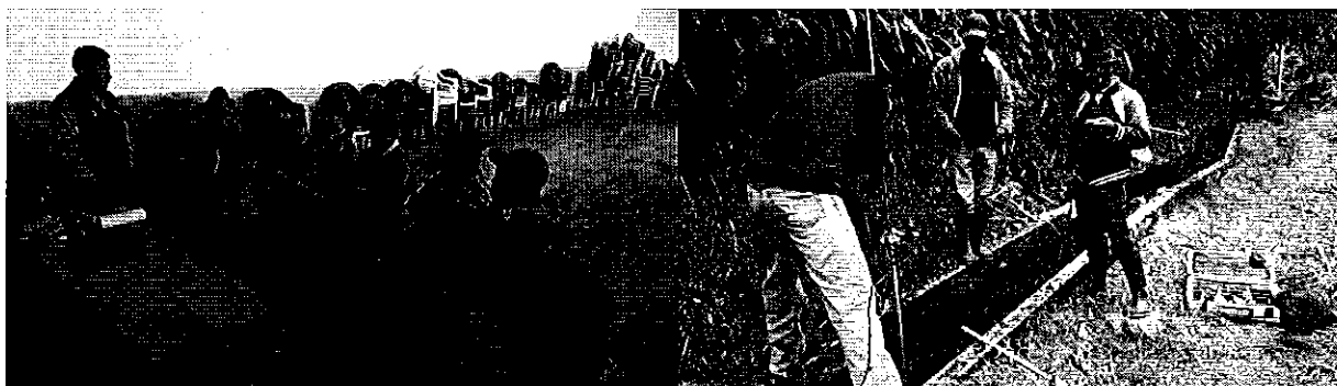
Fotografía 2. Representantes de las Juntas de Riego PERIBUELA-IMANTAG, participantes en la reunión de trabajo y de medición de caudales