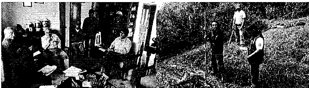
Fotografía 1. Representantes de las Juntas de Aguas La Palestina, participantes en la reunión de trabajo y de medición de caudales