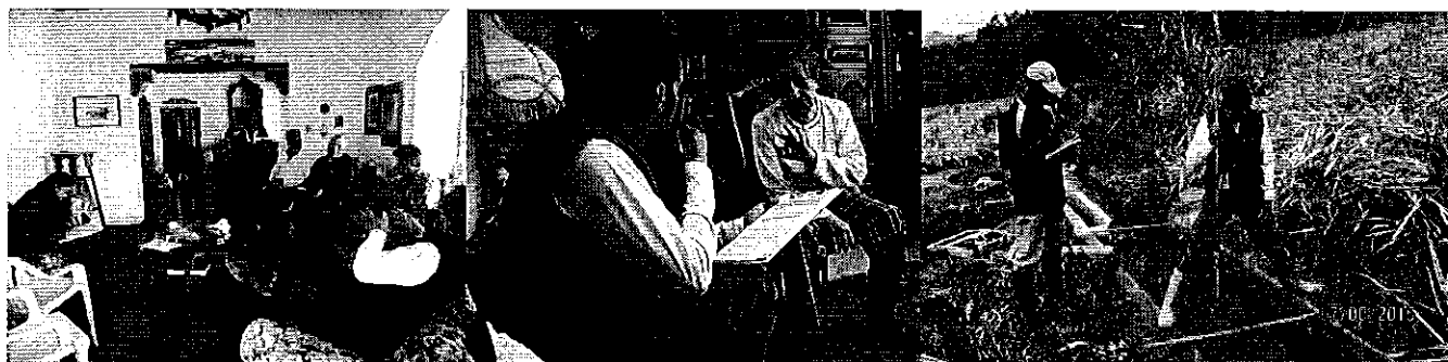
Fotografía 1. Visita, recorrido, aforamiento a la Acequia Vena de Oro