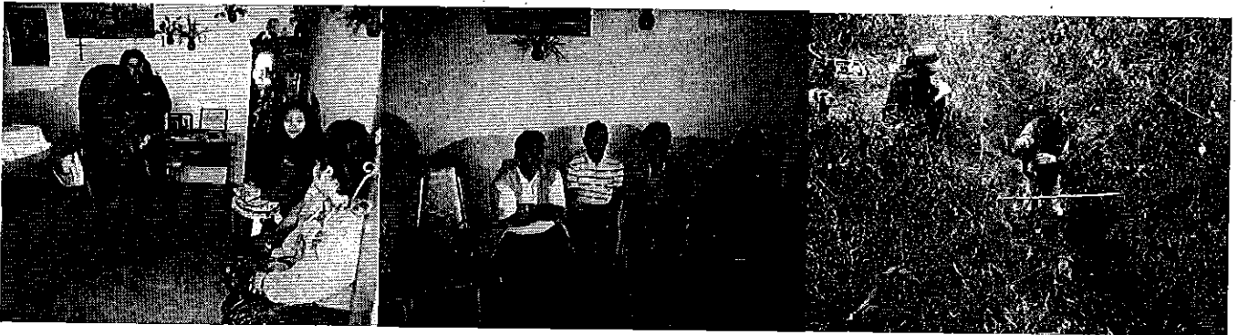
Fotografía 3. Visita, recorrido, aforamiento a la Acequia Garrapatal