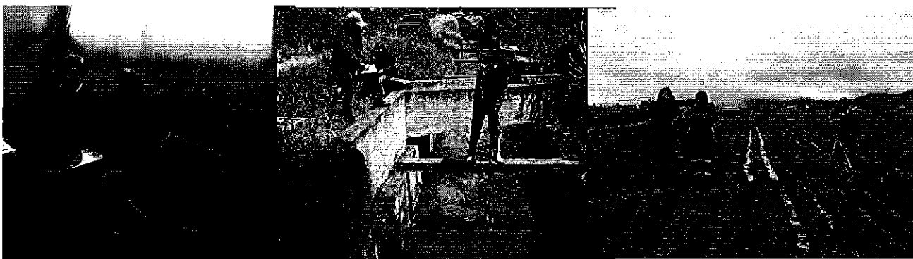
Fotografía 2. Visita, recorrido, aforamiento al Sistema de Riego Montúfar.