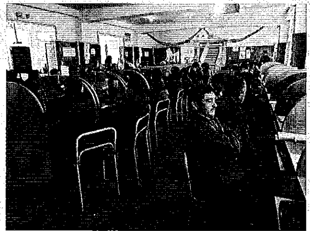
Fotografía 2. Ejecución del taller de difusión con los prestadores del servicio público de riego y drenaje de la provincia del Carchi.