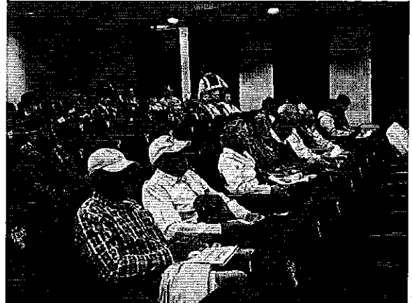
Fotografía 1. Ejecución del taller de difusión con los prestadores del servicio público de riego y drenaje de la provincia de Imbabura.