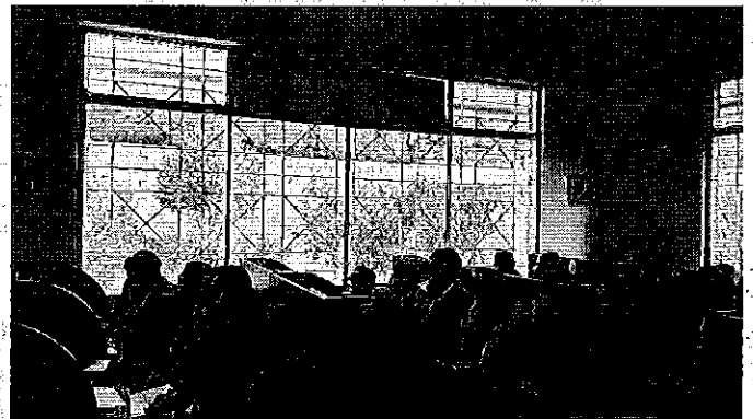
Fotografía 3. Ejecución del taller de difusión con los prestadores del servicio público de riego y drenaje de la provincia de Pichincha.