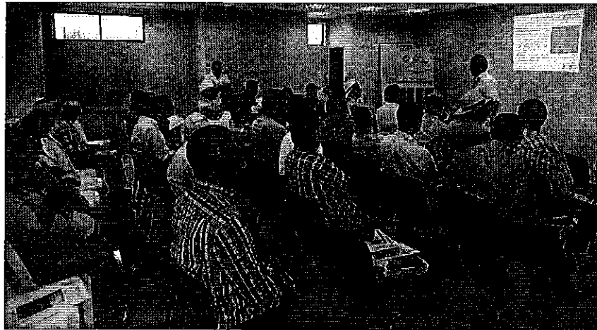
Fotografía 3. Taller de difusión de la Regulación Nacional Nro. DIR-ARCA-RG-009-2018, con representantes de los PSRD de la provincia de Los Ríos.