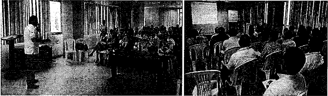
Fotografía 1. Taller de difusión de la Regulación Nacional Nro. DIR-ARCA-RG-009-2018, con representantes de los PSRD de la provincia de El Oro.