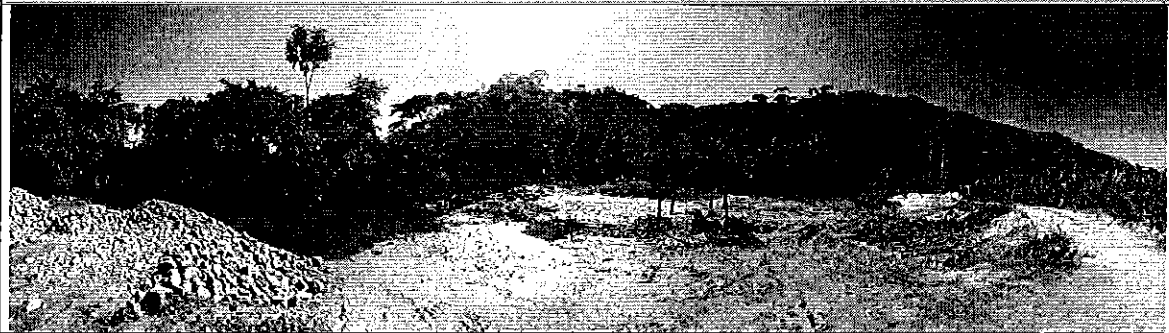
Fotografía 3. Inspección técnica a área minera EL PINDAL