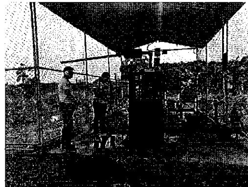
Fotografía 1. Inspección técnica en el predio de la Compañía REYBANPAC C.A.