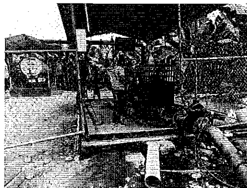
Fotografía 2. Inspección técnica en el predio de la Compañía REYBANPAC C.A.