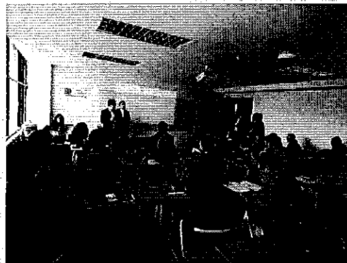
Fotografía 1. Evento de fortalecimiento BDE-ARCA en la ciudad de Ambato.