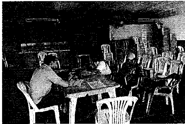
Fotografía 1.- Reunión de trabajo con representantes de los PSRD