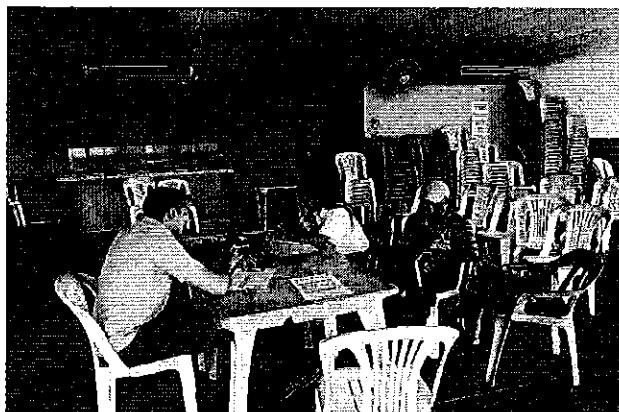
Fotografía 1.- Reunión de trabajo con representantes de los PSRD