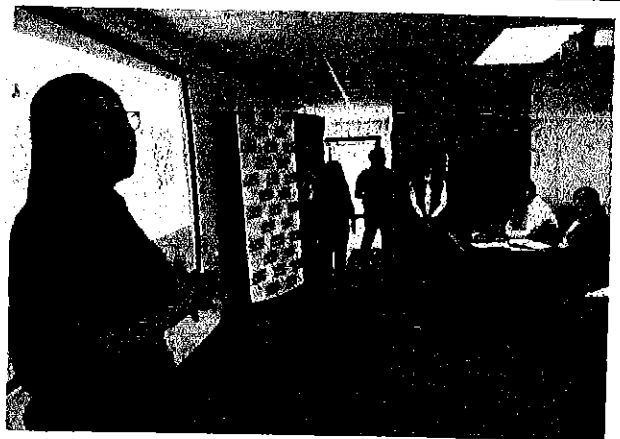
Fotografía 2. Taller de difusión de la normativa emitida por la ARCA.