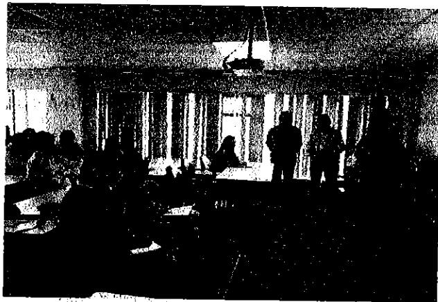
Fotografía 1. Taller de difusión de la normativa emitida por la ARCA.