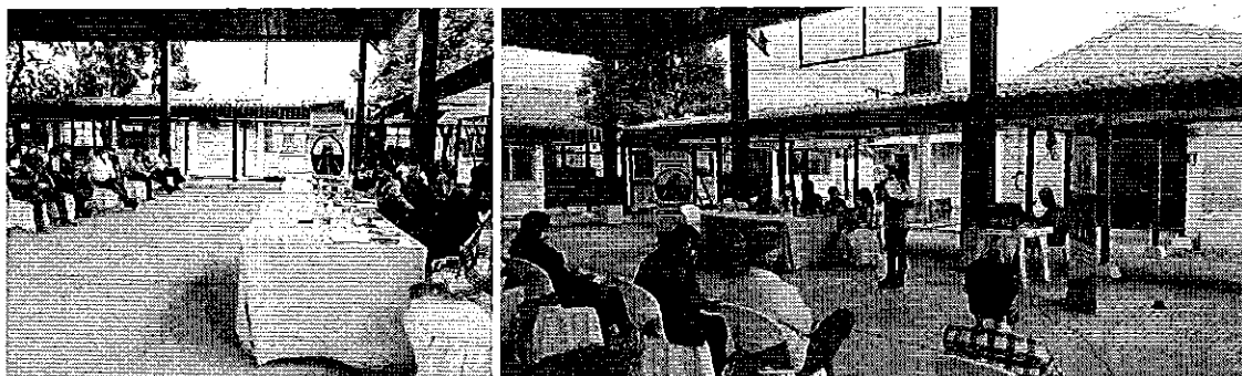
Fotografía 1 y 2. Socialización de la Regulación Nro. DIR-ARCA-RG-009-2018 y DIR-ARCA-RG-010-2021