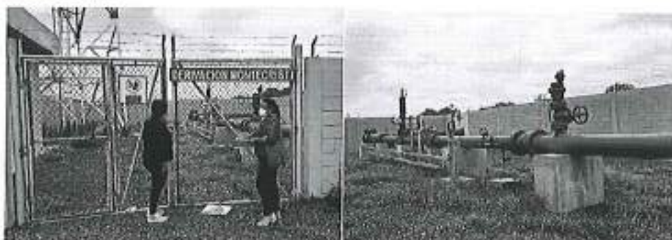
Inspección técnica en la derivación del acueducto La Esperanza - El Aromo de la Refinería del Pacífico del GADM de Montecristi.