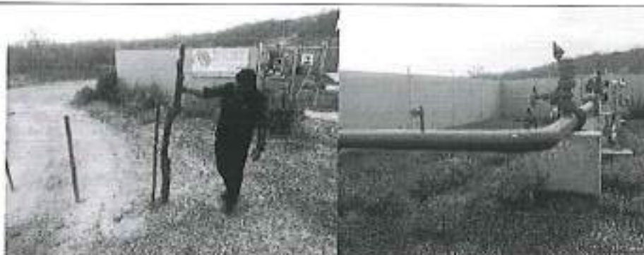
Inspección técnica en la derivación del acueducto La Esperanza - El Aromo de la Refinería del Pacífico del GADM de Jaramijó.