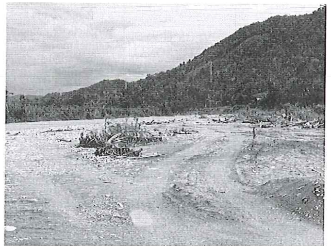
Fotografía 8. Área proyecto embaulamiento del río