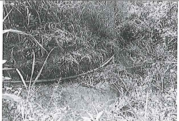
Fotografía 2. Desvío de la fuente sin nombre