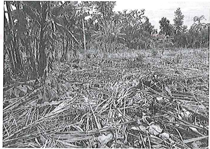
Fotografía 6. Inundación de terrenos aledaños al río Bomboiza