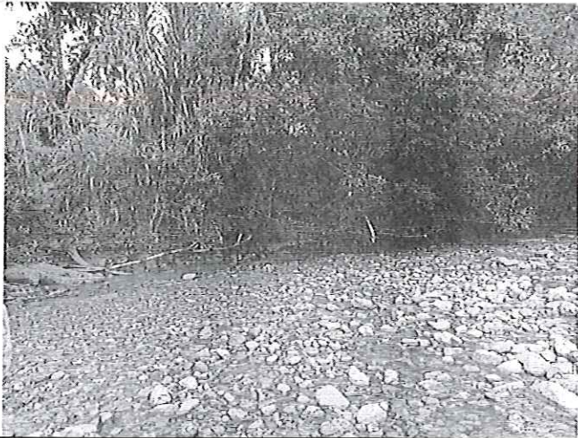
Fotografía 5. Socavamiento de las riberas del río Bomboiza