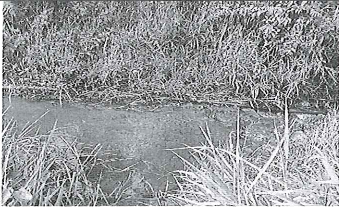
Fotografía 1. Vertiente sin nombre