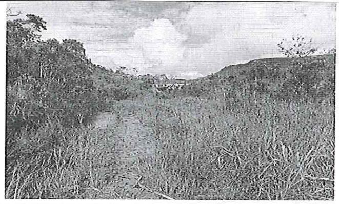
Fotografía 4. Desvío de cauce a través de un embaulamiento de profundidad aproximada de 2 metros.