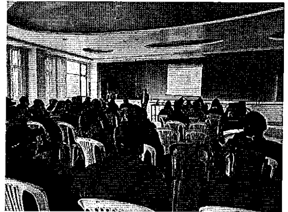
Fotografía 6. Taller de difusión Prestadores comunitarios - 01 de abril de 2022