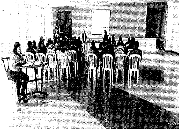
Fotografía 5. Taller de difusión Prestadores comunitarios - 01 de abril de 2022