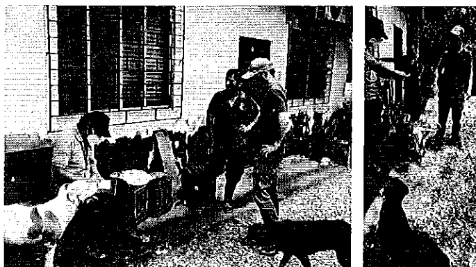
Fotografía 4. Inspección técnica en el predio de la compañía AGROVICOL S.A