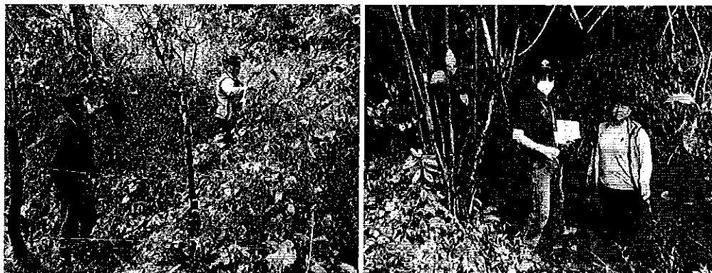
Fotografía 1. Inspección técnica en la Quebrada Rarón