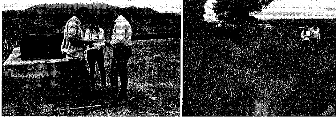
Fotografía 1. Inspección técnica en el predio de la compañía COAZUCAR