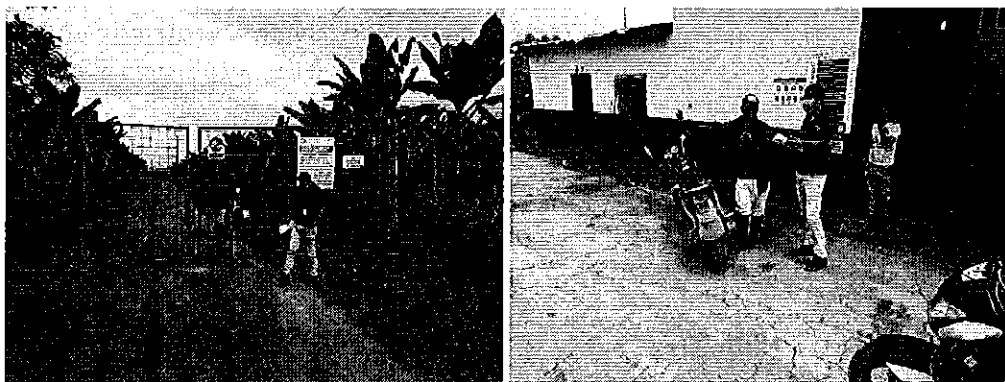
Fotografía 2. Inspección técnica en el predio de la hacienda Cristina