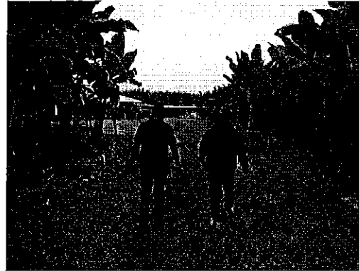
Fotografía 5. Inspección técnica en el predio de la Compañía ALFONQUIR S.A.