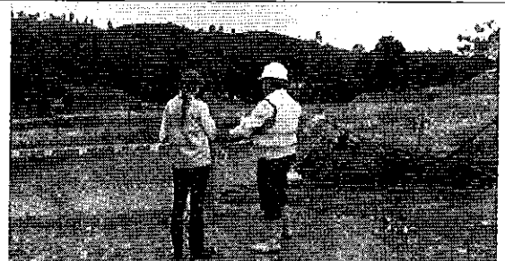
Fotografía 2. Inspección técnica concesión minera Campo Norsul