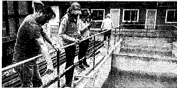
Fotografía 1. Inspección técnica concesión minera Ximena 1