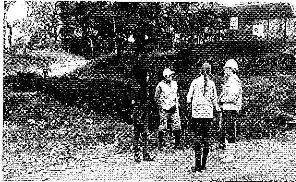
Fotografía 3. Inspección técnica concesión minera Hamiltom