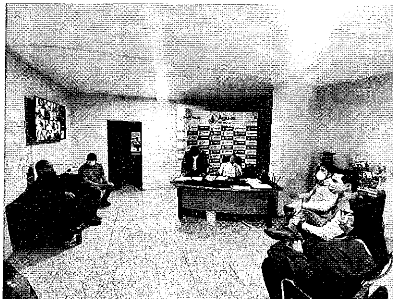
Reunión inicial con el personal de la ARCSA y Aguas Machala EP