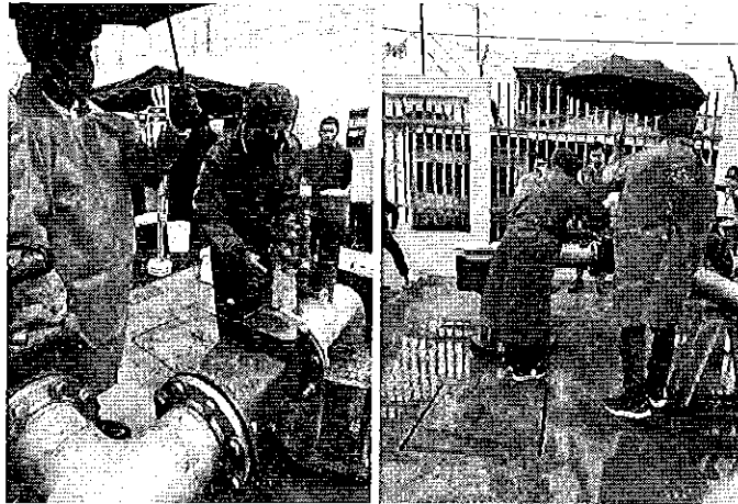
Toma de muestras en el sector Gonzalez Rubio