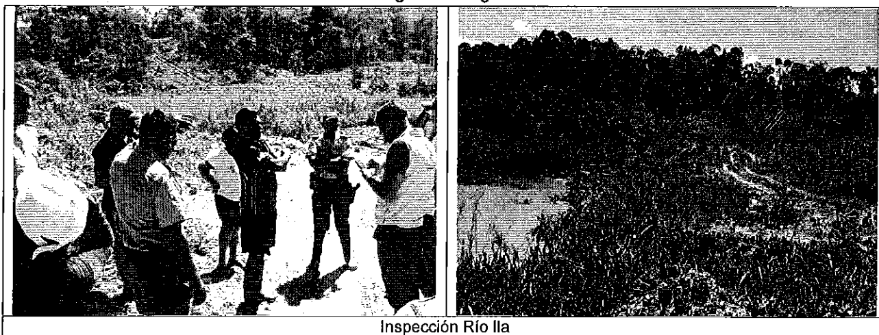
Inspección Río Ila