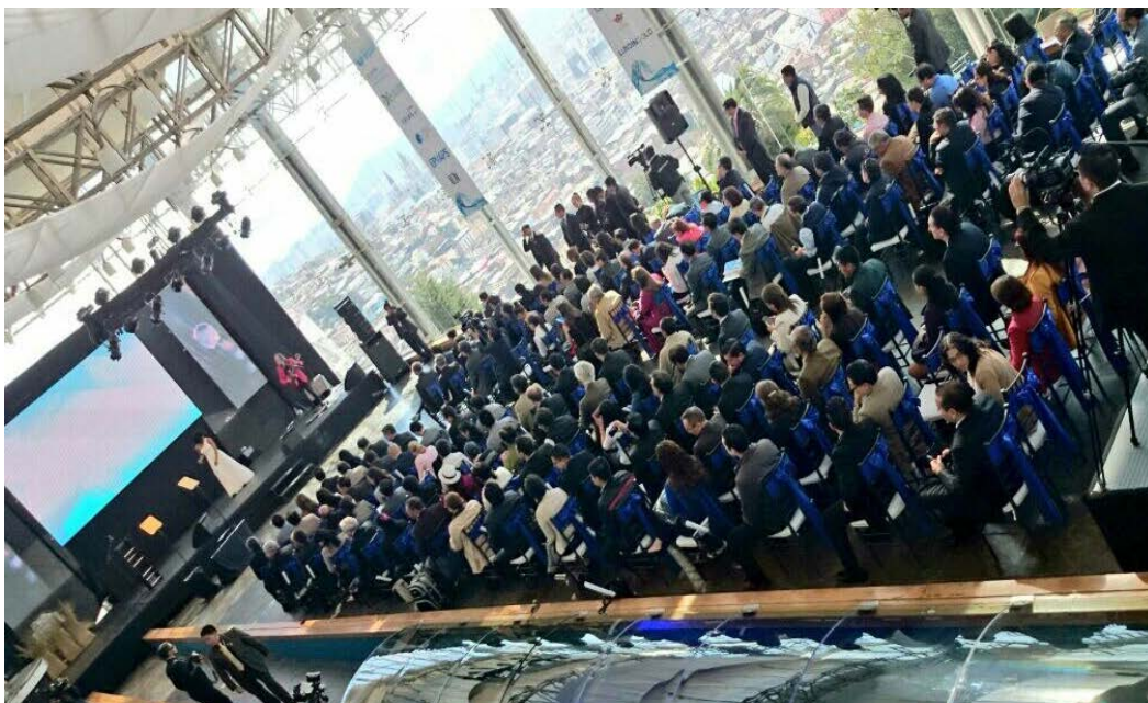
Asistentes al Ier Foro Internacional del Día Mundial del Agua

El Foro acogió aproximadamente a 200 personas en los dos días de su realización, los invitados pudieron apreciar la experticia de los conferencistas quienes entre otros temas mostraron sus conocimientos y experiencias en riego y Drenaje, Agua Potable y Saneamiento, Gestión Integral del Recurso Hídrico, y demás.