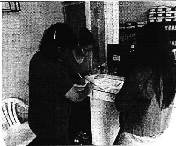
Ilustración 2. Entrega de informe de control de agua