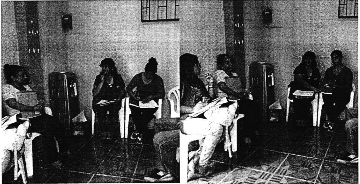
Ilustración 1. Reunión Junta de Agua el Retiro, cantón Machala