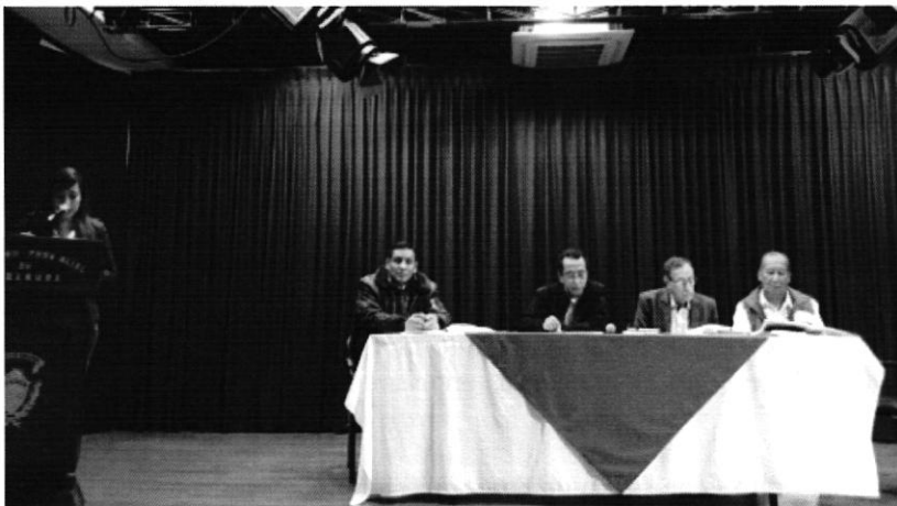
Participación del Director Técnico de Gestión Institucional ARCA en la Segunda Reunión de la Mesa del Ambi

Este punto se trató conforme se discutían los puntos anteriores.