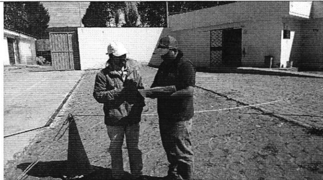
Fotografía 1. Reunión con los representantes del DIRECTORIO DE AGUAS DE LA ACEQUIA ALTA DE CONANVALLE