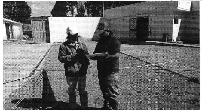
Fotografía 1. Reunión con los representantes del DIRECTORIO DE AGUAS DE LA ACEQUIA ALTA DE CONANVALLE