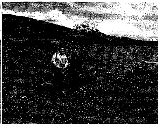
Ilustración 2. Inspección Embalse La Mica