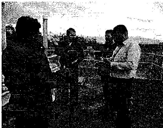
Ilustración 1. Inspección planta de tratamiento El Troje