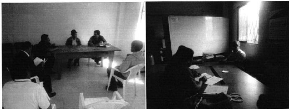
Fotografía 2. Participantes en las reuniones y entrega de los informes técnicos a las JRC de la provincia de Bolívar