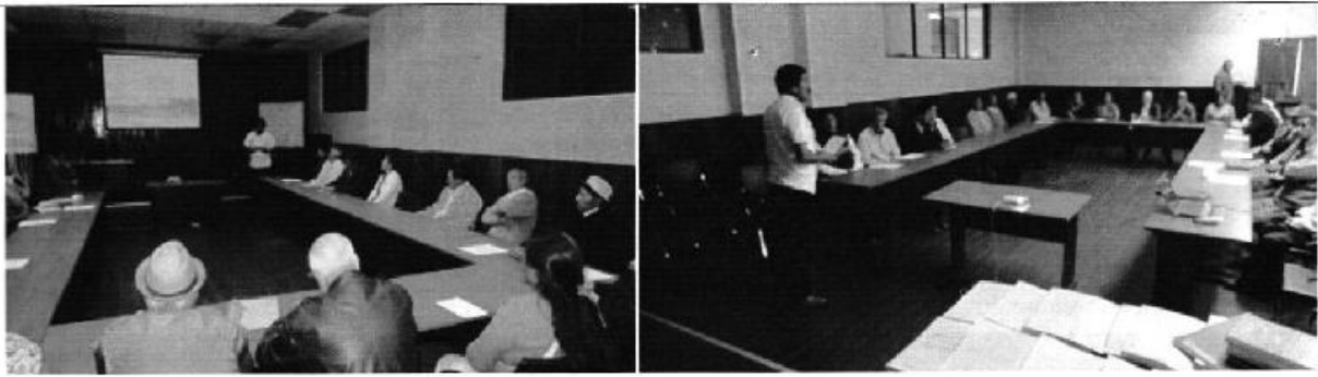
Fotografía 1. Participantes en la reunión de trabajo con las JRC de las provincias de Azuay y Cañar