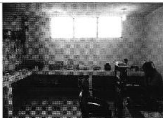
Ilustración 4. Equipos electrónicos y reactivos.