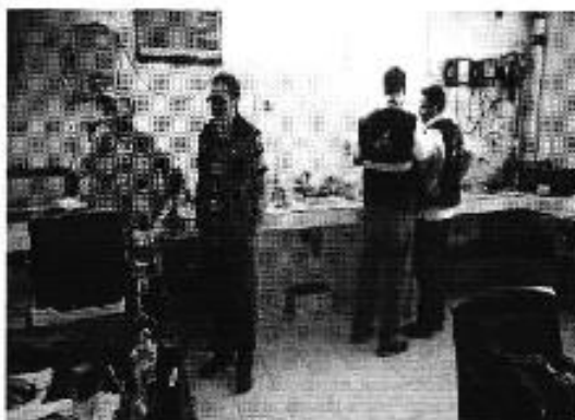
Ilustración 9. Inspección del laboratorio con los funcionarios de la ARCSA.