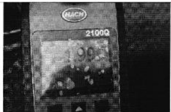
Ilustración 6. Medición de la turbidez en la línea de distribución de agua potable.