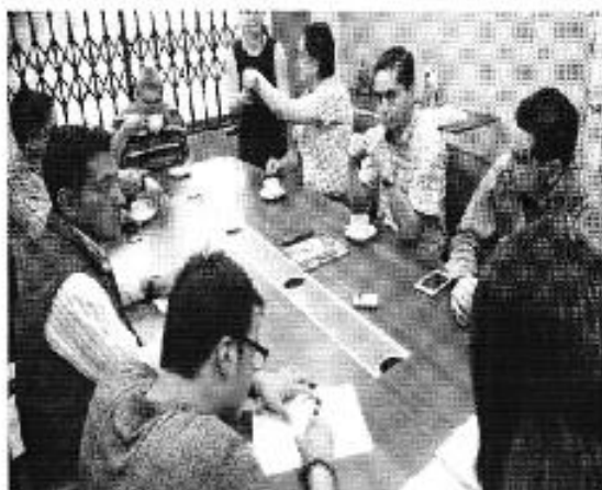
Ilustración 1. Reunión con los funcionarios de la SENAGUA y EMAARS-EP.