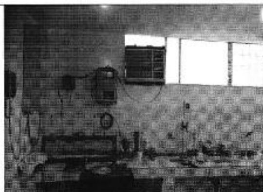
Ilustración 3. Equipo de pruebas de jarras y material volumétricos de vidrio.