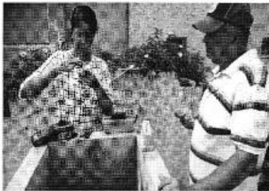
Ilustración 7. Medición de cloro residual en la línea de distribución de agua potable.