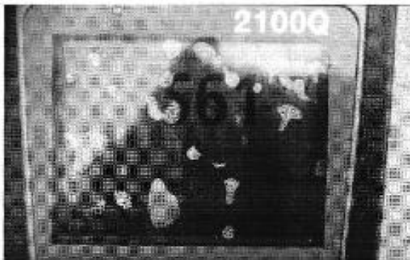
Ilustración 5. Medición de la turbidez en la línea de ingreso a la planta de tratamiento.