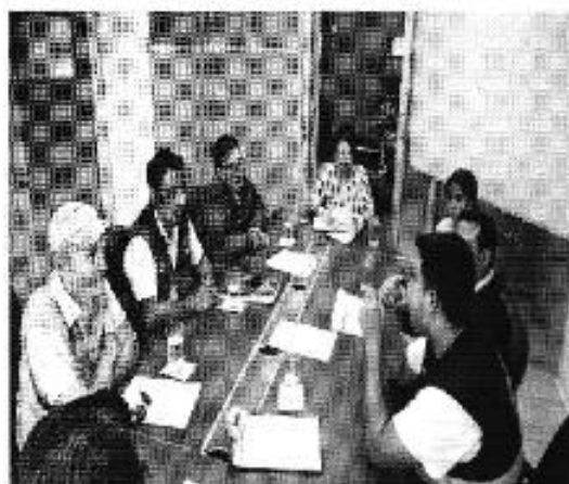
Ilustración 2. Reunión con los funcionarios de la SENAGUA, ARCSA y EMAARS-EP.