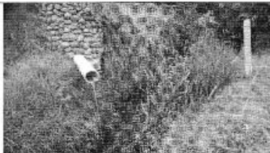
Ilustración 13. Descarga de aguas residuales al Río Cumbe