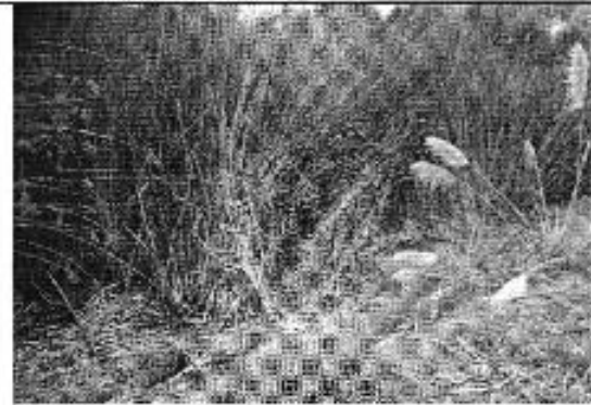
Ilustración 12. Lagunas de oxidación en la parroquia Tarquí