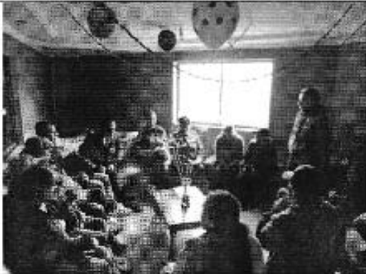
Ilustración 5. Oficinas del DASC