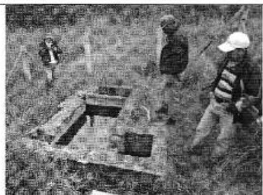
Ilustración 2. Captación del DASC