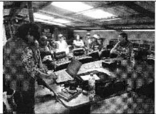
Ilustración 4. Oficinas del DASC