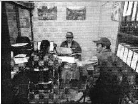
Ilustración 3. Oficinas del DASC