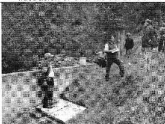
Ilustración 7. Captación del DAS-TVP