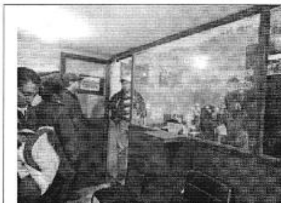
Ilustración 1. Oficinas del DASC