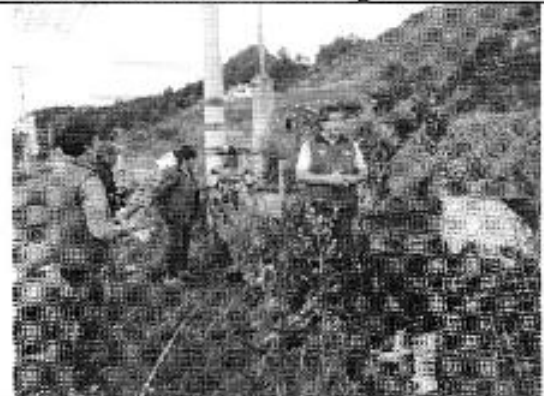
Ilustración 10. Distribución de agua Tarqui