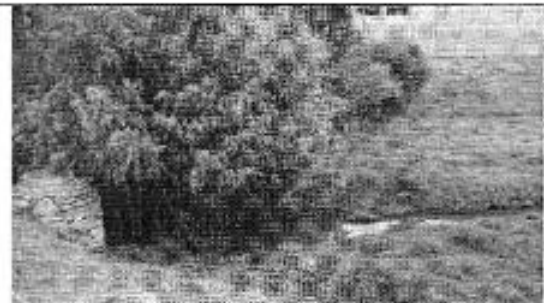
Ilustración 14. Descarga de aguas residuales al Río Cumbe