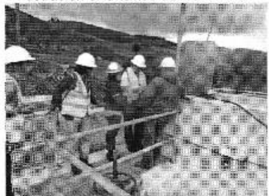
Ilustración 8. Planta de agua IRQUIS