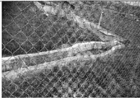
Ilustración 11. Fosa séptica para descarga de aguas residuales en la parroquia Victoria del Portete