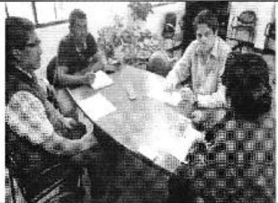
Ilustración 6. Oficinas de ETAPA EP