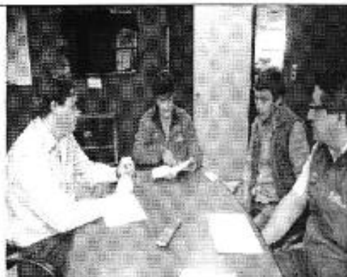
Ilustración 5. Reunión con Subgerente de ETAPA