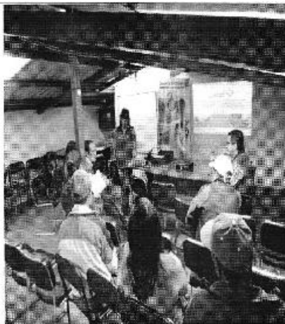
Ilustración 3. Presentación de la institucionalidad