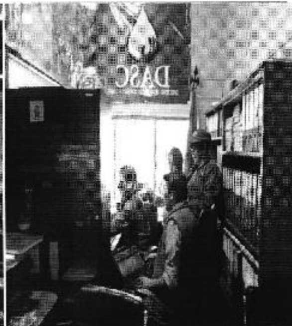
Ilustración 4. Recolección de documentos e información Con el directorio de agua del sistema Cumbe