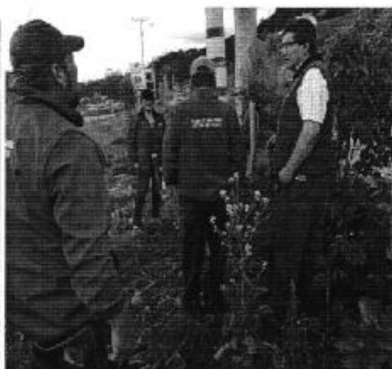
Ilustración 8. Revisión de servicios de agua potable a consumidores