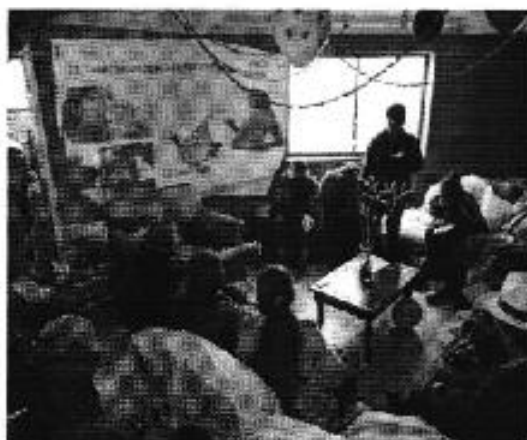
Ilustración 9. Explicación importancia calidad del agua en sistema de agua Tarqui-Victoria de Portete