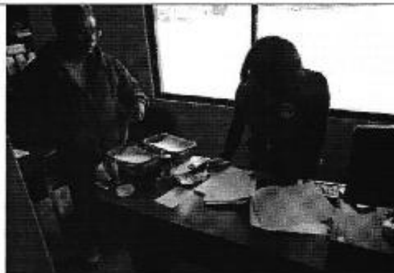
Ilustración 6. Firma de acta con el directorio de agua del sistema Tarqui-Victoria de Portete