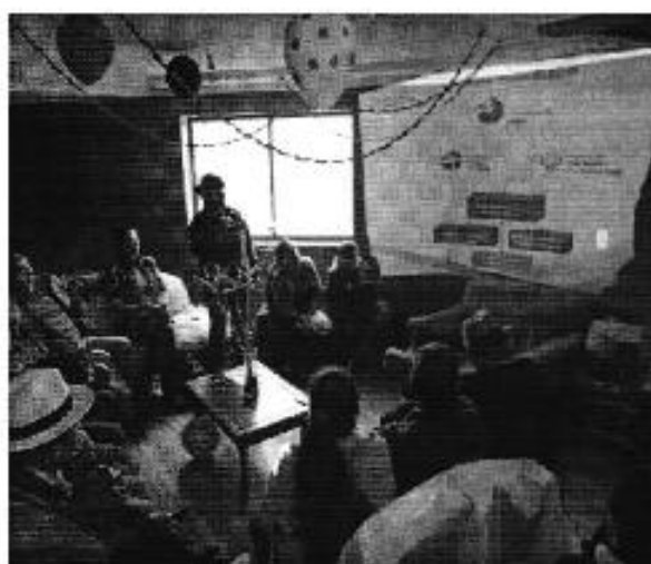
Ilustración 7. Presentación de la Institucionalidad en el directorio de agua del sistema Tarqui-Victoria de Portete