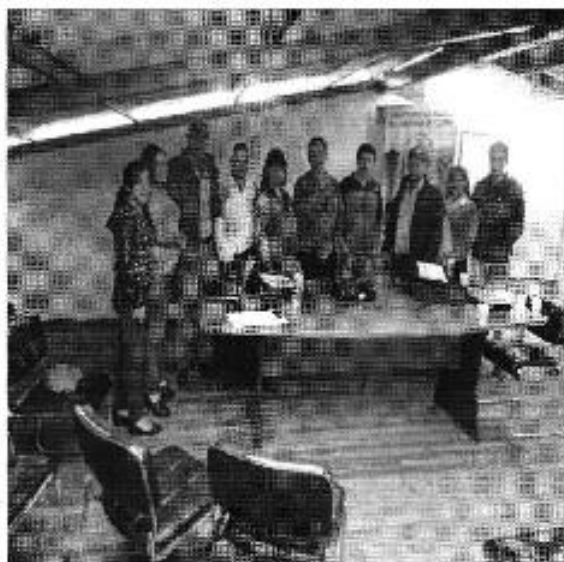
Ilustración 2. Con el directorio de agua del sistema Cumbe