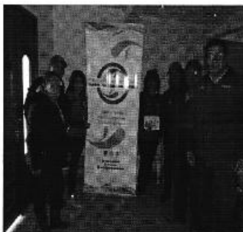
Ilustración 10. Finalización de la Jornada con directivos de sistema de agua de Tarqui-VP