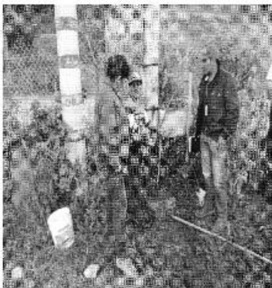
Ilustración 1. Visita a un consumidor de agua en la parroquia Tarqui