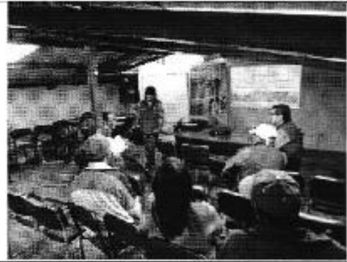
Ilustración 2. Capacitación del DASC