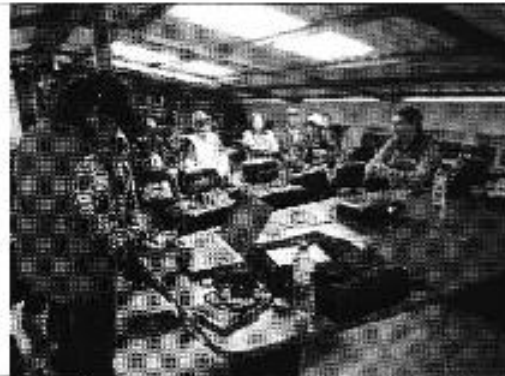
Ilustración 4. Presentación al DASC