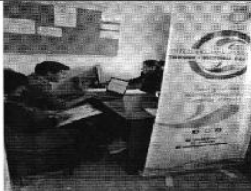
Ilustración 5. Oficinas del DAS-TVP