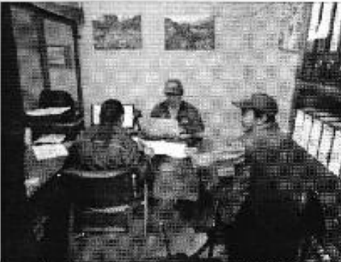
Ilustración 3. Oficinas del DASC