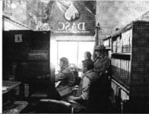
Ilustración 1. Oficinas del DASC