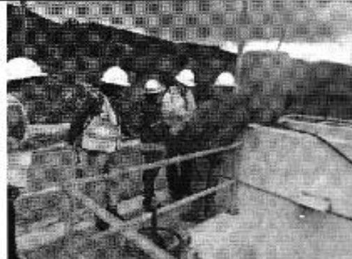
Ilustración 6. Planta de agua IRQUIS