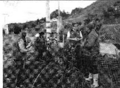
Ilustración 8. Distribución de agua Tarquí