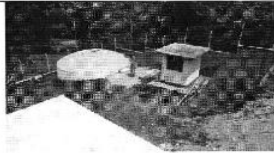
Figura 6. Tanque de reservorio de 50 m 3 se encuentra operativo.