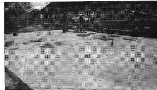
Figura 5. Construcción del reservorio para agua tratada de 500 m 3 .