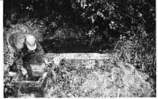
Figura 2. Inspección de la fuente de captación Campanarumy