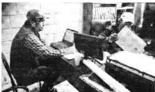
Figura 11. Recopilación de información