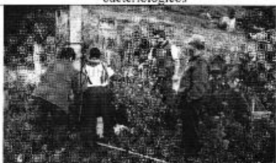
Figura 14. Verificación del servicio de agua potable