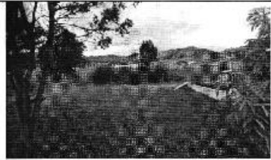
Figura 18. Lagunas de oxidación de aguas residuales inhabilitadas