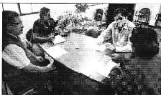
Figura 15. Reunión con ETAPA-EP