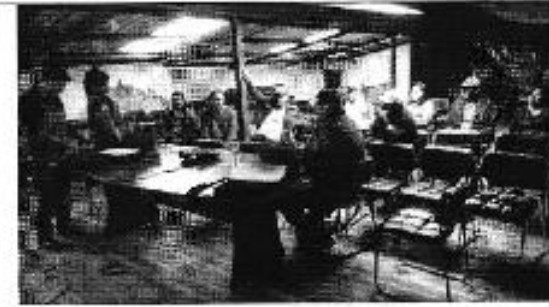
Figura 8. Presentación de la institucionalidad de la ARCA a la DASC