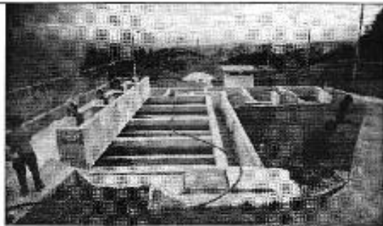
Figura 9. Planta de tratamiento de agua potable de Cumbe