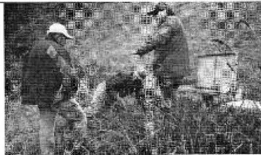
Figura 3. Revisión del desarenador en la fuente de captación Campanarumy