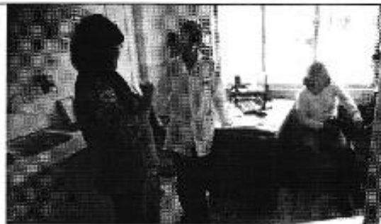
Figura 10. Conversatorio en el subcentro de salud de la parroquia Cumbe sobre la calidad de agua potable que brinda el DASC