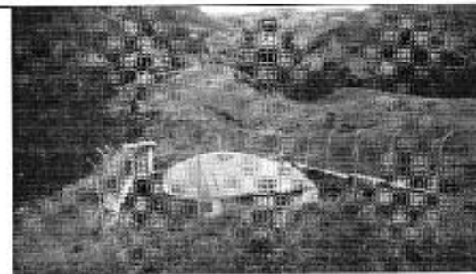
Figura 7. Planta de desinfección Urkururu