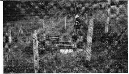
Figura 4. Fuente de captación Yutuajina