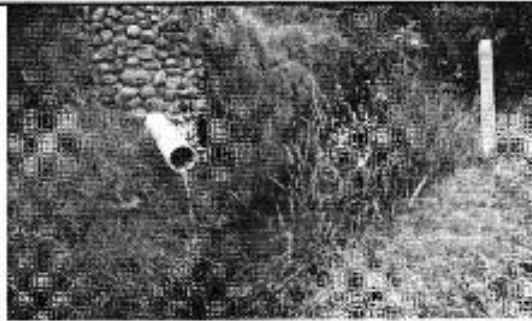
Figura 17. Inspección de las descargas de aguas residuales