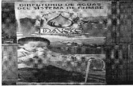
Figura 1. Socialización y actividades de control en el Directorio de Aguas del Sistema de Cuzco (DASC)