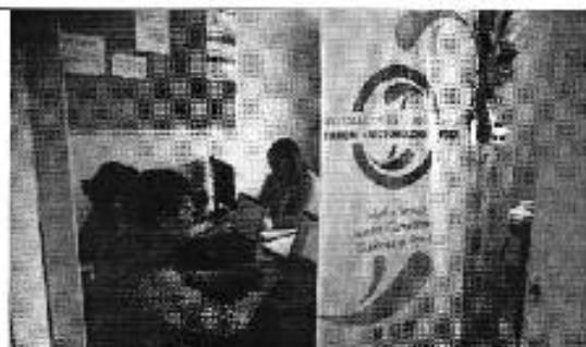
Figura 13. Socialización y actividades de control en el Sistema Comunitario de Agua Tanqui-Victoria del Portete (SC-TVP)