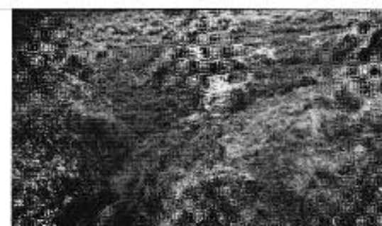
Figura 16. Inspección del proyecto minero en el páramo de Quinsaloma.