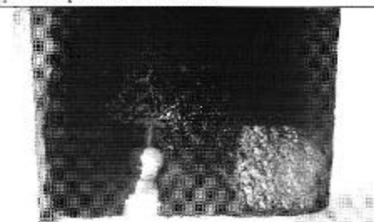
Figura 12. Muestreo del agua tratada del DASC para realización de los análisis físicos, químicos y bacteriológicos