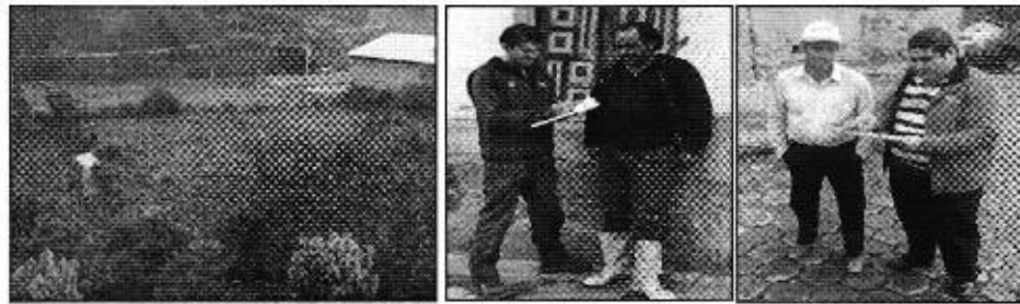
Fotografía 1. Reunión de trabajo con el Directorío, recorrido a la zona de captación, aforo y encuestas del "Directorío de Aguas del Canal de Riego Jur Montalvo".