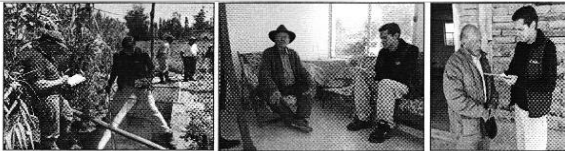
Fotografía 3. Reunión de trabajo con el Directorio, recorrido a la zona de captación, aforo y encuestas a la "Junta de Aguas Cananville".