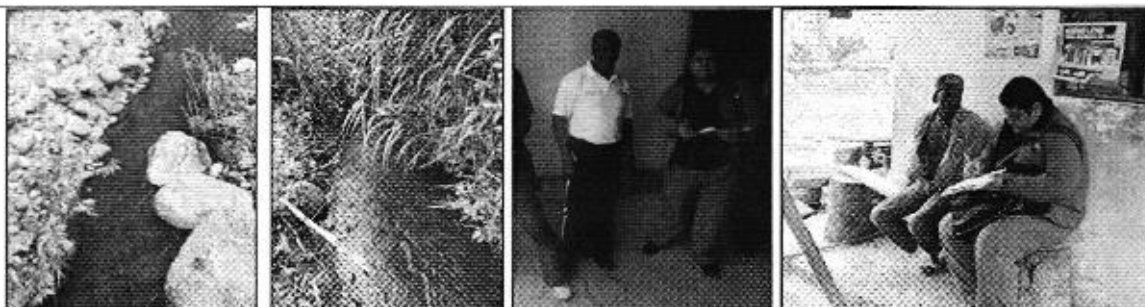
Fotografía 5. Recorrido a la zona de captación, aforo y entrevistas a los consumidores del "Asociación de Trabajadores Agrícola Mascarilla".