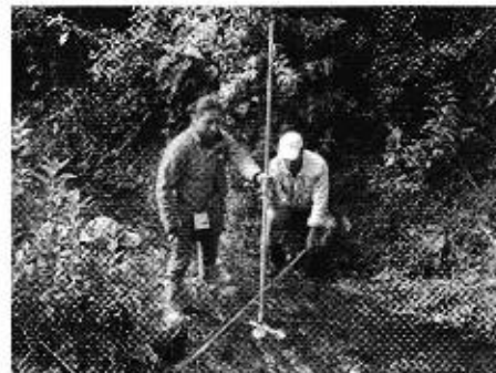
Fotografía 3. Reunión con los directivos de la Junta de Aguas de la Acequia Yanayacu, entrevistas a consumidores, recorrido por el sistema de riego y aforo de caudales.