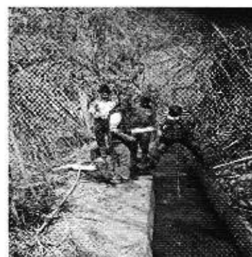
Fotografía 2. Reunión con los directivos de la Junta de Aguas de la Acequia Pambahiendra, entrevistas a consumidores, aforo de caudales.