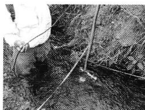
Fotografía 4. Reunión con los directivos de la Junta de Aguas de la Acequia La Alegría, entrevistas a consumidores, recorrido por el sistema de riego y aforo de caudales.