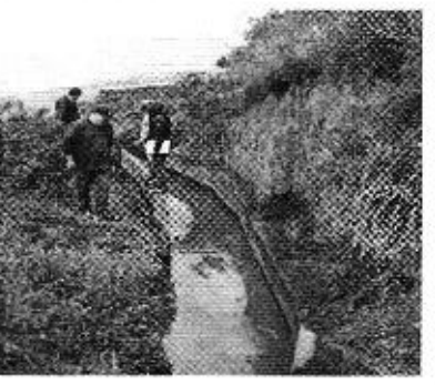
Fotografía 1. Reunión con los directivos de la Junta de Aguas de la Acequia Pueblo Viejo, entrevistas a consumidores y recorrido por el sistema de riego.