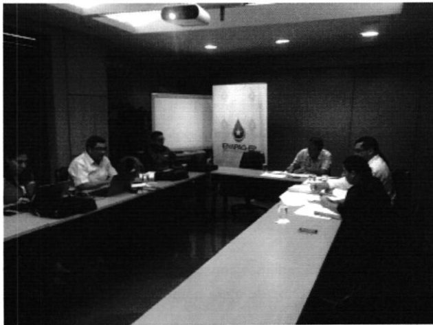
FIGURA: EMAPAG EP