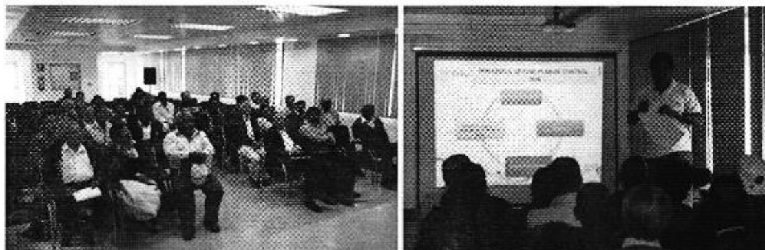
Fotografía 1. Representantes de las Juntas de riego Comunitarias participantes en la reunión de trabajo, Ibarra - Imbabura