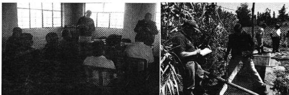
Fotografía 3. Reunión de trabajo con representantes de la Junta de Riego, aforos en la captación y canal de riego Cananvalle y recorrido por el canal de riego.