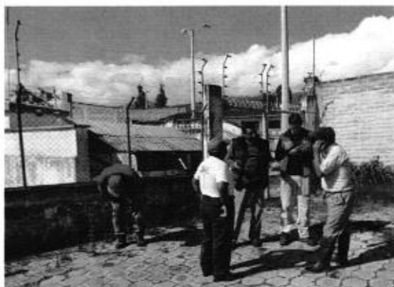
Profesionales de la ARACA y representantes del Canal de riego Cananvalle en: Reunión para la aplicación de Ficha Técnica, Recorrido por el sistema, medición de caudales y entrevista a los consumidores.