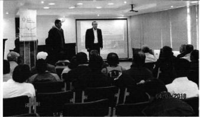
Profesionales de la ARCA , GAD Imbabura y representantes de Prestadores Servicio de Riego Comunitario en la reunión de planificación.