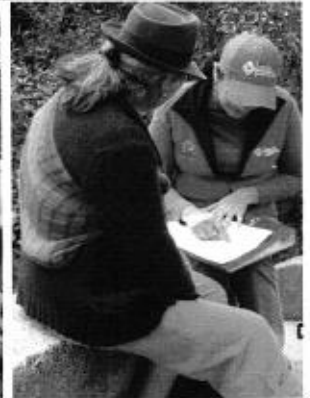
Profesionales de la ARCA , SENAGUA y representantes del Canal de riego Pueblo Viejo en: Recorrido por el sistema, medición de caudales y entrevista a los consumidores.