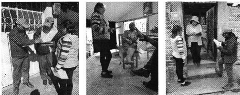
Fotografía 3. Coordinación y entrega de invitación a los representantes del Prestador de Servicio de Riego Comunitario. Chimborazo