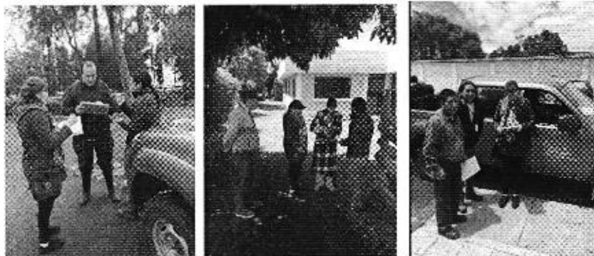
Fotografía 1. Coordinación y entrega de invitación a los representantes del Prestador de Servicio de Riego Comunitario. Cotopaxi