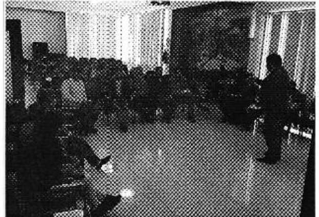
Fotografía 1. Representantes de los PSRC participantes en la reunión de trabajo, Latacunga - Cotopaxi