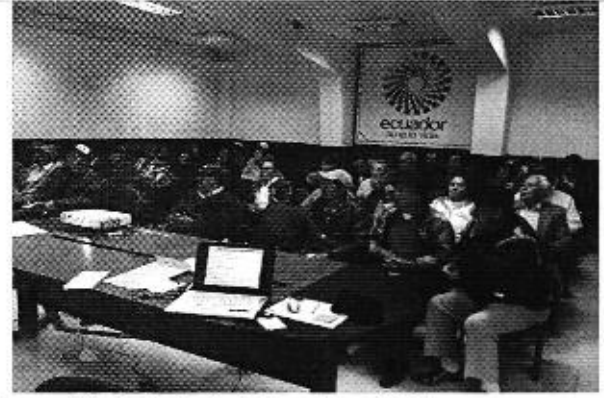
Fotografía 3. Representantes de los PSRC participantes en la reunión de trabajo, Riobamba - Chimborazo.