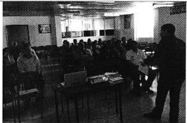
Fotografía 2. Representantes de los PSRC participantes en la reunión de trabajo, Ambato - Tungurahua