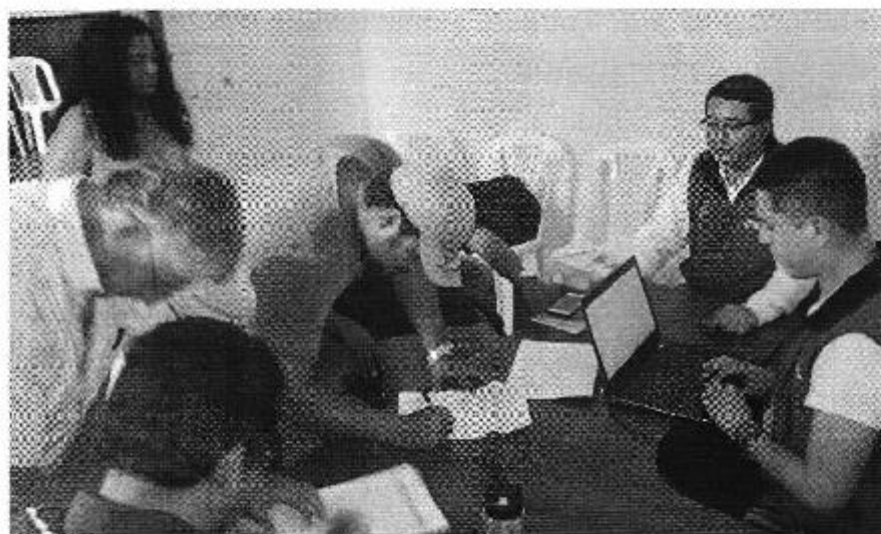
Ilustración 1. Reunión con los directivos para la lectura y aprobación del Acta de Compromisos en las Oficinas provisionales del GADM de Montecristi