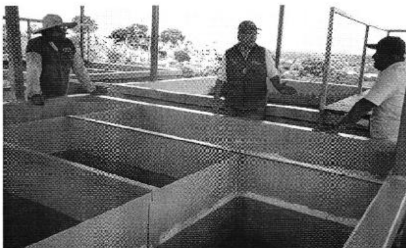
Ilustración 1. Inspección a los sistemas de agua potable que maneja el GAD de Montecristi.