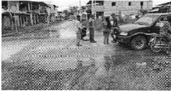
Figura: Evaluación del sistema de alcantarillado sanitario en las calles del cantón - Flavio Alfaro