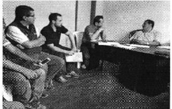
Figura 4: Reunión previa con el señor Alcalde de Montecristi y funcionarios del MICSE para inicio de las actividades de evaluación de los sistemas de agua potable y saneamiento - Montecristi