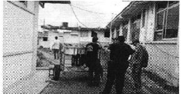
Figura 2: Inspección de la planta de tratamiento portátil para las instalaciones del Hospital Básico del cantón- Flavio Alfaro