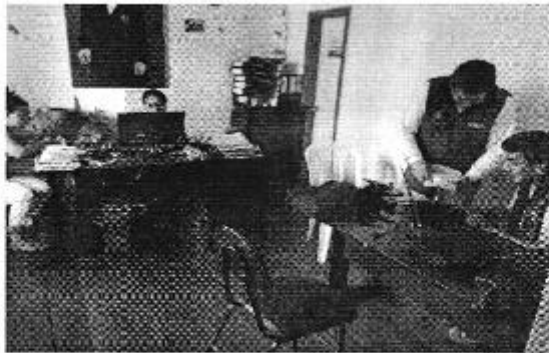
Figura 3: Elaboración de Actas en las oficinas provisionales del GADM de Montecristi- Montecristi