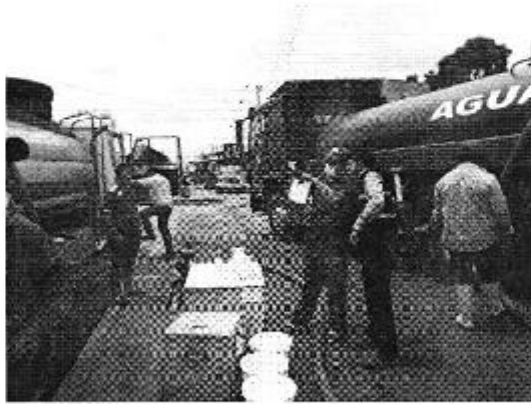
Figura 3: Medición concentración de cloro en tanquero de distribución - Cantón Pedernales