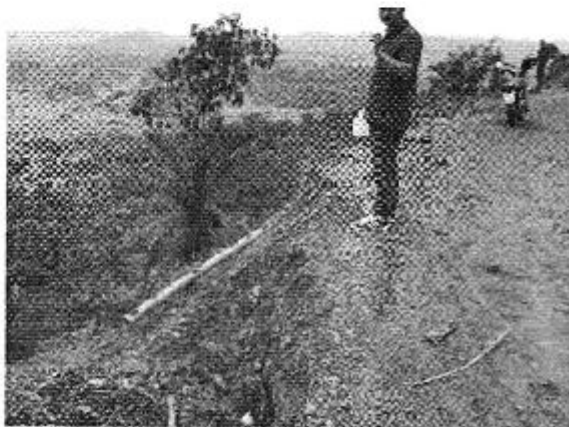
Figura 1: Destrucción de la tubería de conducción de la captación del Sitio Facundo - Cantón Flavio Alfaro