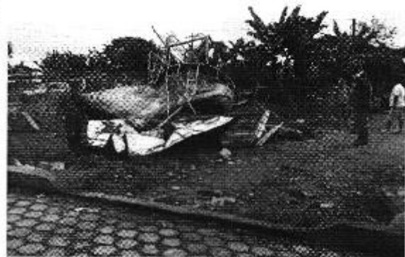
Figura 2: Tanque elevado colapsado por terremoto en el Barrio 4 de diciembre - Cantón El Carmen