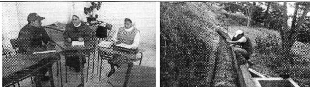
Fotografía 1. Reunión con los representantes de la Junta de Aguas El Quince Yahuarcocha y medición de caudales