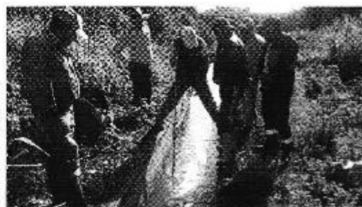
Fotografía 3. Reunión con los representantes de la Junta de Aguas de la Acequia Santiago de Monjas y medición de caudales