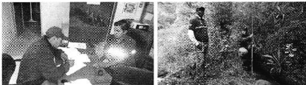
Fotografía 2. Reunión con el Representante de la EPA del Sistema de riego bi-provincial Santiaguillo