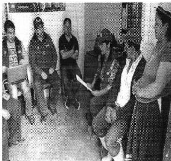
Ilustración 2. Lectura del acta de control en la Organización Comunitaria PAYGUARA