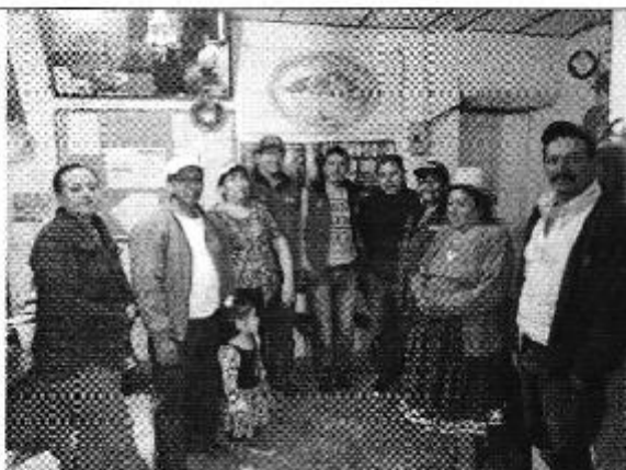
Ilustración 3 . Misión cumplida ARCA y Organización PAYGUARA