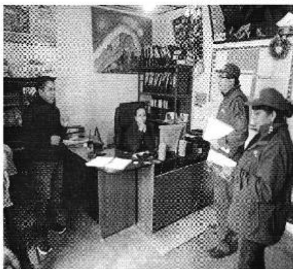
Ilustración 1. Presentación de la Institucionalidad en la Organización Comunitaria PAYGUARA