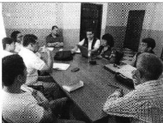
Ilustración 4. Lectura y aprobación del acta de control en la Empresa de Agua AGUAPAS del cantón Pasaje