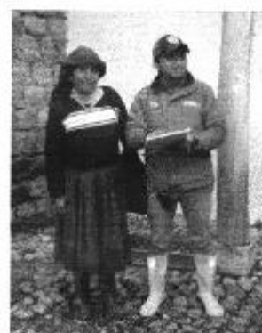
Fotografía 3. Recopilación de información, aforo de caudales y encuestas a consumidores de la Asociación Agropecuaria Manuel Freile Barba La Magdalena.