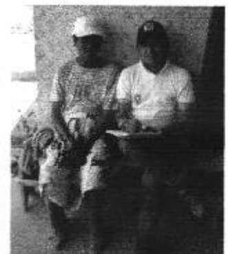
Fotografía 2. Recopilación de información, aforo de caudales y encuestas a consumidores de los Ex Huasipungueros de la Hacienda La Victoria.