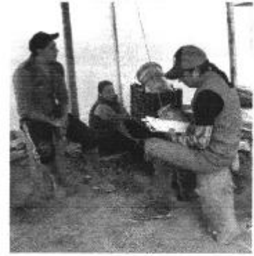
Fotografía 1. Recopilación de información, aforo de caudales y encuestas a consumidores de la Junta de Aguas de la Acequia La Esperanza Ramal El Inca.