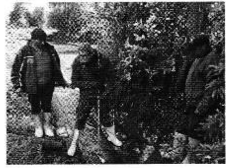
Fotografía 2. Der. Reunión de trabajo, centro. Aplicación de encuestas a los consumidores e, izq. Aforo de caudales del Directorio de Aguas San Antonio de Aláquez.