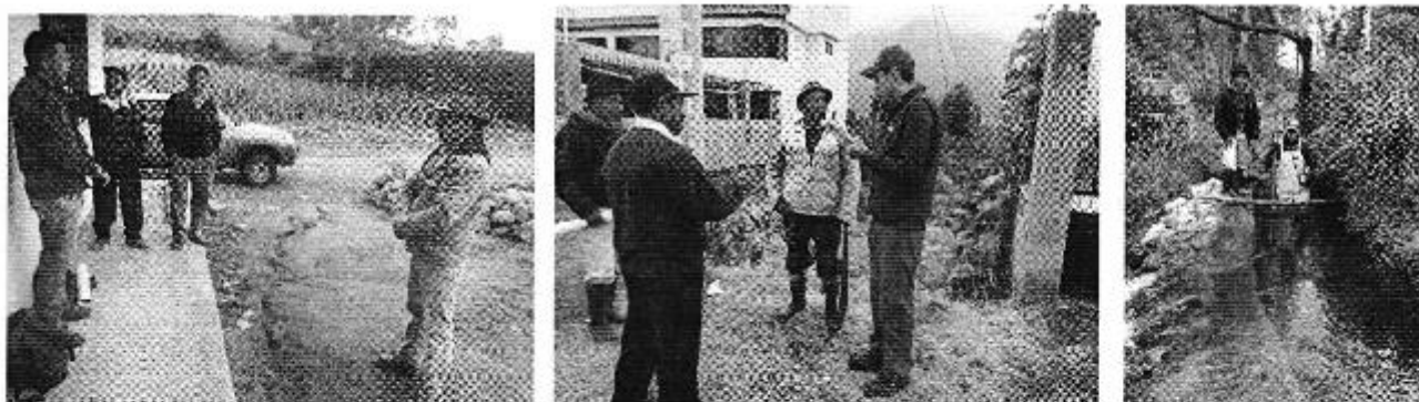
Fotografía 3. Der. Reunión de trabajo, centro. Aplicación de encuestas a los consumidores e, izq. Aforo de caudales del Directorio de Aguas de la Acequia Ignacio Flores.