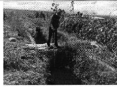
Fotografía 4. Der. Reunión de trabajo, centro. Aplicación de encuestas a los consumidores e, izq. Aforo de caudales del Directorio de Aguas de la Cooperativa San Vicente de Mulalillo.