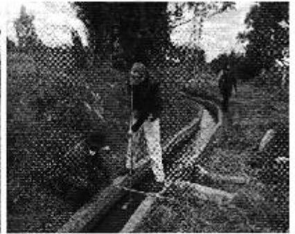
Fotografía 1. Der. Reunión de trabajo, centro. Aplicación de encuestas a los consumidores e, izq. Aforo de caudales del Directorio de Aguas Pupana Pusulivi.