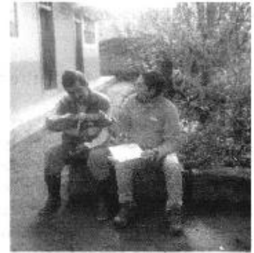
Fotografía 4. Recopilación de información y encuestas a consumidores del Directorio de Aguas de la Acequia de San Miguelito.