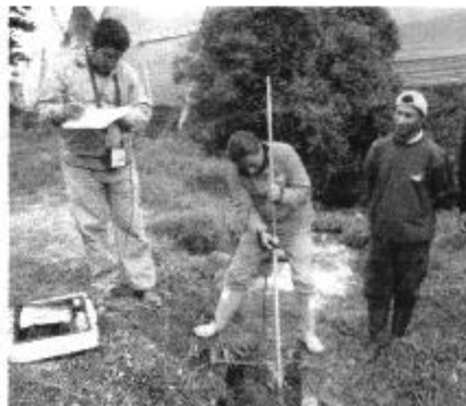
Fotografía 3. Recopilación de información, aforo de caudales y encuestas a consumidores del Directorio de Aguas de la Acequia Leito.