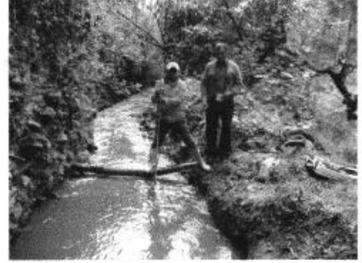
Fotografía 1. Recopilación de información, aforo de caudales y encuestas a consumidores del Directorio de Aguas de la Acequia Catiglata La Península.