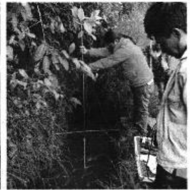
Fotografía 2. Recopilación de Información, aforo de caudales y encuestas a consumidores del Directorio de Aguas de la Acequia Quillán La Playa.