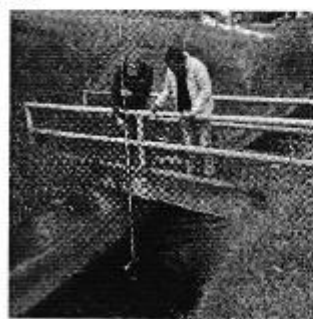
Fotografía 4. Der. Reunión de trabajo, centro. Aplicación de encuestas a los consumidores y, izq. Aforo de caudales del Directorio del Sistema de Riego Canal Píllaro Ramal Sur.