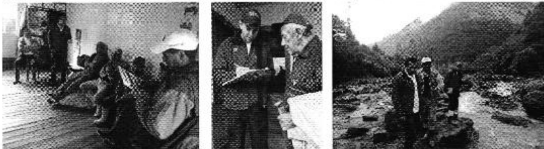
Fotografía 2. Der. Reunión de trabajo, centro. Aplicación de encuestas a los consumidores y, izq. Visita al sitio de captación del sistema de riego del Directorio de Aguas de Riego Loroguchana Galpón.