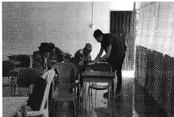
Ilustración 1. . Revisión de la información comercial, administrativa y financiera que maneja la Junta Administradora de Agua Potable (JAAP) Guaranguisito.