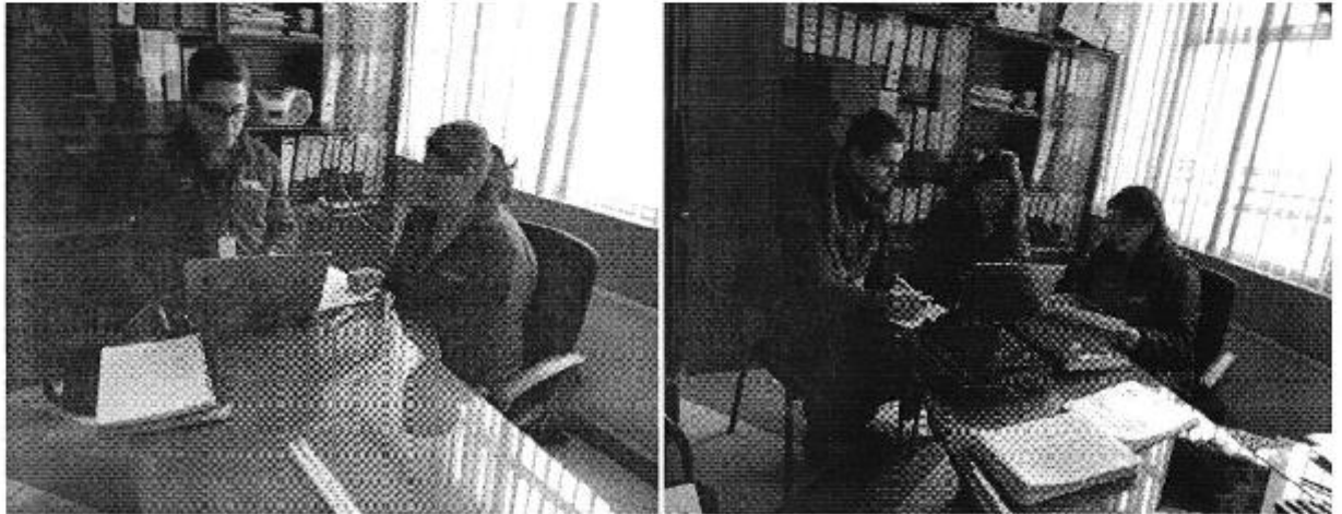
Ilustración 2. Revisión de la información comercial, administrativa y financiera que maneja de la Empresa Pública de Agua Potable y Alcantarillado de Tulcán EPMAPA-T.