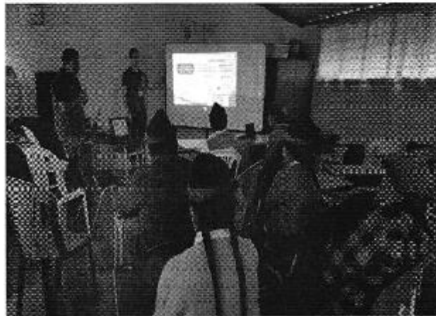
Ilustración 3. Presentación de la Regulación Nro. DIR-ARCA-RG-003-2016 a la Junta Administradora de Agua Potable (JAAP) Guaranguisito.