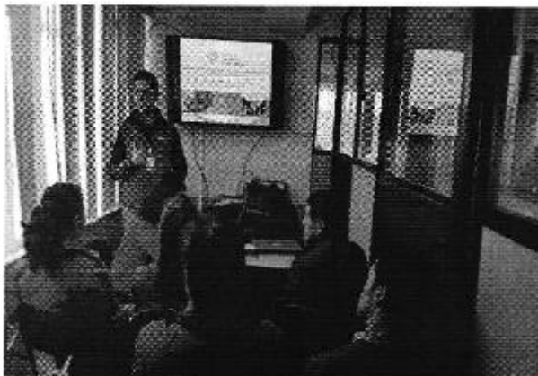
Ilustración 1. Presentación de la Regulación Nro. DIR-ARCA-RG-003-2016 en el Cantón Tulcán a través de la Empresa Pública de Agua Potable y Alcantarillado de Tulcán EPMAPA-T, y a la Junta Administradora de Agua Potable (JAAPA) Tufiño.