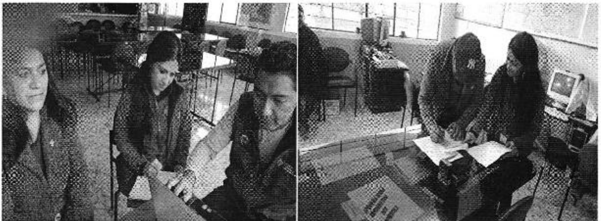
Ilustración 2. Revisión de la información comercial, administrativa y financiera que maneja de la Junta Administradora de Agua Potable y Alcantarillado (JAAP) Tufiño y firma de actas de compromiso.