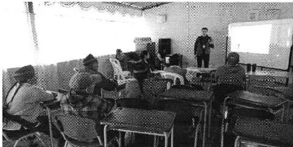
Ilustración 3. Presentación de la Regulación Nro. DIR-ARCA-RG-003-2016 a la Junta Administradora de Agua Potable (JAAP) Guaranguisito.