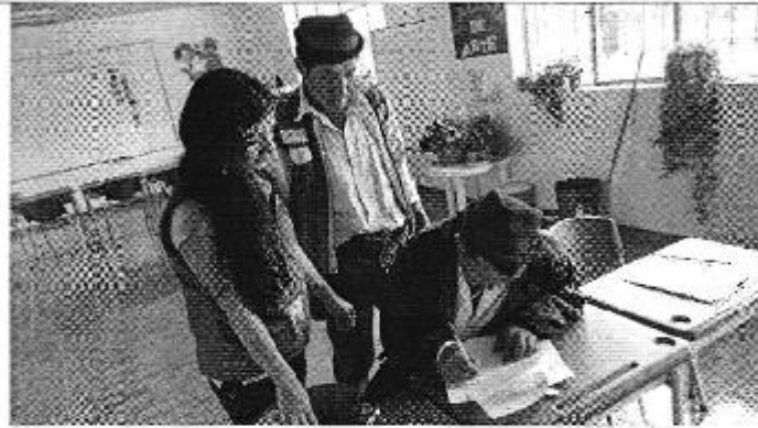
Ilustración 1. . Firma de acta al presidente de la Junta Administradora de Agua Potable (JAAP) Guaranguisito.