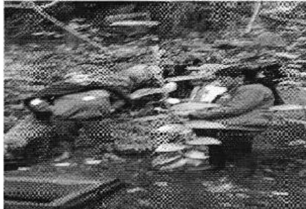
Ilustración 1. Visita de Control al sitio de captación denominada Monte Redondo de la Junta Administradora de Agua Potable (JAAP) Tufiño en el Cantón Tulcán.